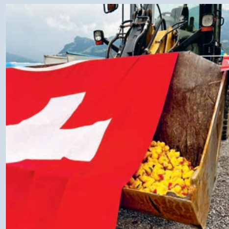
Der Bagger entlässt die Entchen in den Kanal

Besten Dank für die grossartige Organisation und allen zahlreichen freiwilligen Unterstützern für die wertvolle Mithilfe! Wir freuen uns schon auf das nächste Jahr und hoffen wiederum auf schönes Wetter.