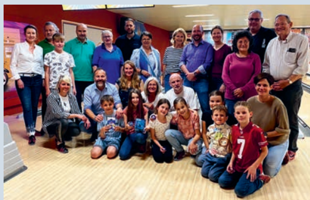
Alle Teilnehmer / innen