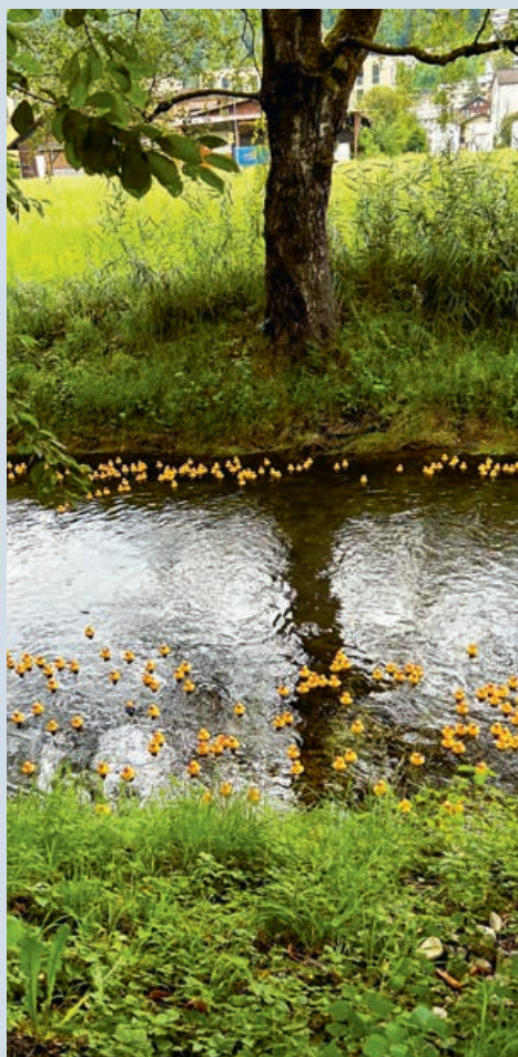
Die Enten sind unterwegs

Anlässlich des schweizerischen Nationalfeiertags am 1. August lud der Schweizer Verein im Fürstentum Liechtenstein bereits zum 16. Mal zum allseits beliebten Entenrennen ein. Bei sonnigem Wetter ging es um 15 Uhr bei Ridamm City los. Es gab wiederum eine Westernolympiade für Klein und Gross mit zahlreichen Aktivitäten. Der grosse Spielplatz lud die Kinder zum ausgelassenen Spielen ein und die Erwachsenen fanden ein Plätzchen auf den Festbänken unter den grossen, schattenspendenden Bäumen. Auch für das leibliche Wohl war wiederum gesorgt. Es wurden leckere Fleischspezialitäten vom Grill und feine, frische Salate vom Buffet angeboten.