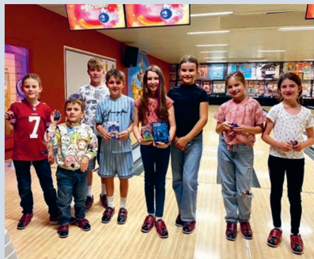
Alle Kinder erhielten einen Preis