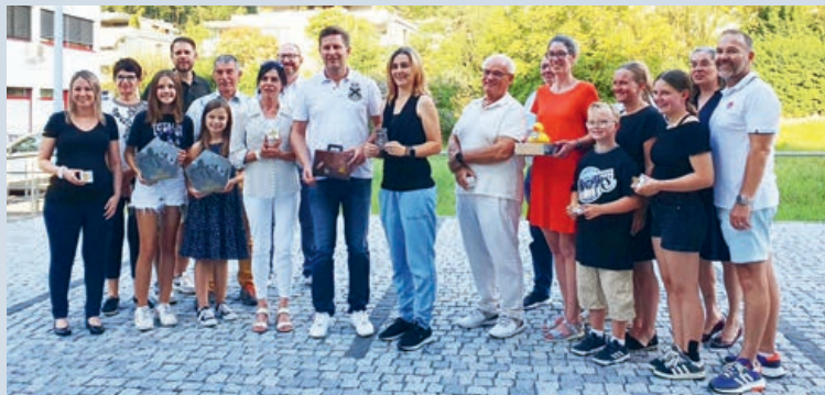
Die Gewinner/innen des Entenrennens erhielten am 28. August 2024 ihre Preise im Lobistro, Lova Center

Der Erlös der verkauften Entenzertifikate wurde dieses Jahr wiederum an Special Olympics gespendet. Der Scheck über CHF 5000.00 wurde am 7. September 2024 anlässlich des Unified Tennisturniers auf der Tennisanlage Vaduz übergeben