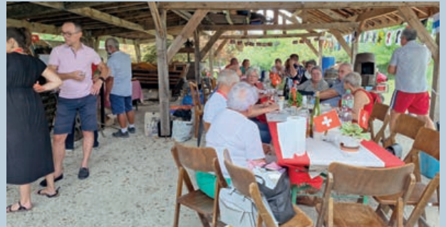
Cercle amical suisse de l'Aube

Immanquablement, les discours et les hymnes nationaux ont initié la journée. L'apéritif préparé par les membres du bureau était accompagné du vin suisse offert par le consul général. L'animation musicale était assurée par le groupe « Cors et Accords » de Cornimont. Une tombola a été organisée, comme toujours, et c'est à chaque fois un moment de surprises. Les participants sont unanimes pour trouver cette rencontre très conviviale. Nous laissons passer l'été et nous clôturons l'année 2024 par la rencontre automnale qui aura lieu le dimanche 24 novembre à l' Auberge Saint Bernard de Bettgeney-Saint-Brice. Nous y dégusterons une bonne choucroute.