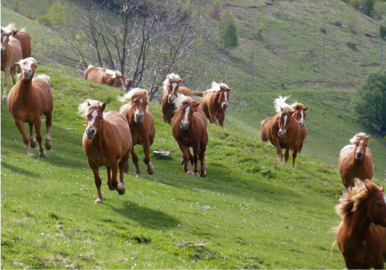
Eine Herde Haflinger Pferde lebt im Sommer wild auf der Alpe Squadrina und der Alpe Pesciò

Hängen des Monte Generoso auf über 900 Metern gelegen. Oben angelangt wird man mit einem grandiosen Panorama belohnt. Der Blick wandert bis zur Po-Ebene und sogar bis nach Mailand. Bei guter Sicht. Diese Landschaft wurde schon von den ersten Touristen, den Engländern, die 1850 hierher kamen, sehr geschätzt.