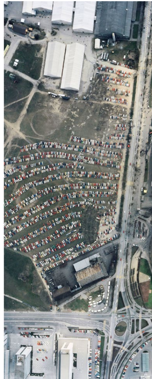
Cupfinal am Ostermontag im Wankdorfstadion in Bern,