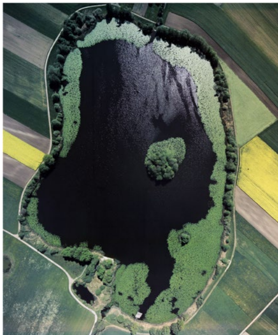
Inkilwilersee zwischen Inkwil und Bolken, 1976