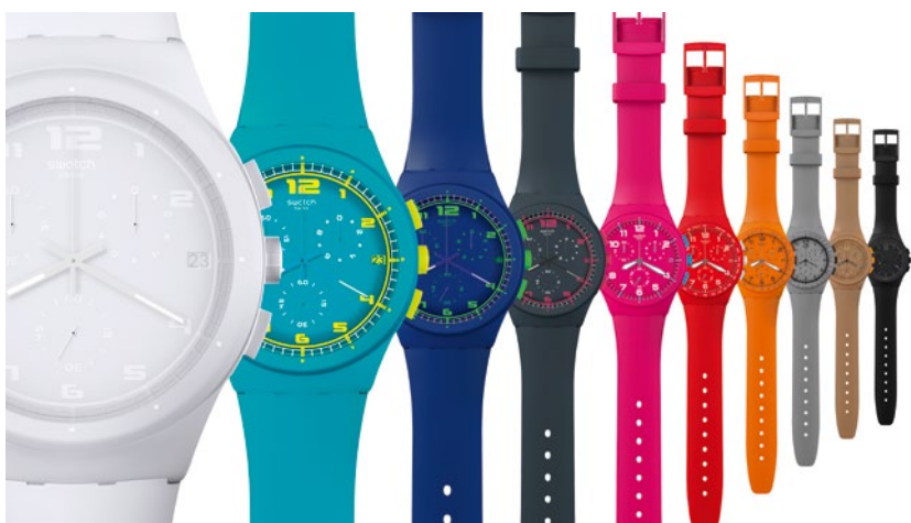
1983 kam die erste Swatch auf den Markt und wurde rasch zum Kultobjekt