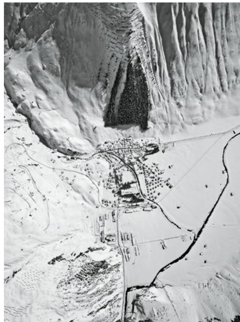
Bannwald bei Andermatt, 1968