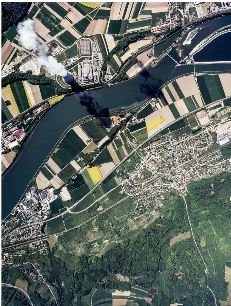
Die Aare mit dem Atomkraftwerk Leibstadt, 1991