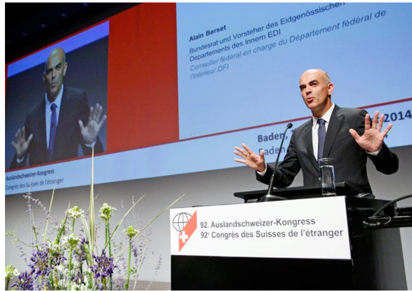
Bundesrat Alain Berset am Auslandschweizerkongress in Baden

Mit der Feststellung, «die Welt wäre ärmer ohne die Auslandschweizer», begann Bundesrat Alain Berset sein Referat. Er nannte zahlreiche Institutionen in der ganzen Welt, die es ohne Auslandschweizer wohl nicht geben würde. Zum Beispiel Hotel Ritz, Chevrolet, die Golden-Gate-Bridge oder Madame Tussauds Wachsfigurenkabinett. Er betonte auch, dass die 730 000 Auslandschweizer wichtige «Botschafter» der Schweiz seien. Hier