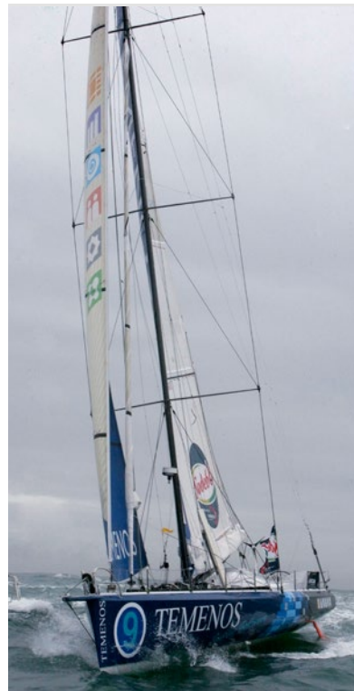
Der Schweizer Skipper Dominique Wavre in Aktion bei der Vendée Globe