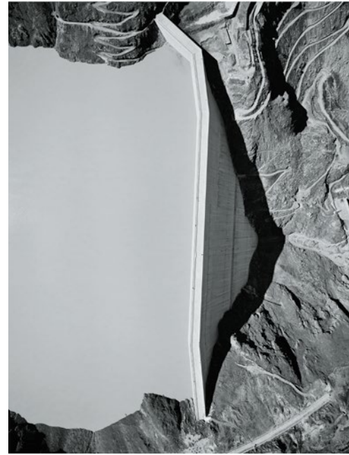
Staumauer Grande Dixence im Val d'Hérémence, 1964

In der Bibliothek der ETH sind Tausende von Luftbildern im Internet über «BildarchivOnline» abrufbar.