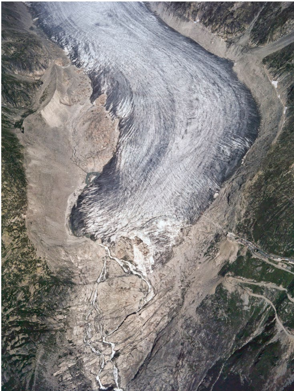
Zunge des Rhonegletschers und Furka-Passstrasse, September 1973