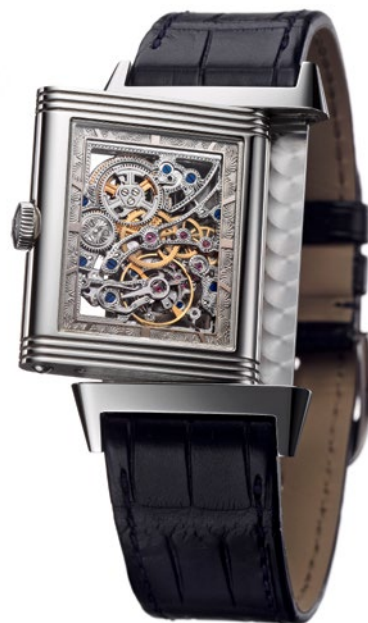
Die legendäre Sportuhr Reverso wird seit 1931 von Jaeger-LeCoultre im Vallée de Joux hergestellt

Dabei beginnt genau hier das jüngste Erfolgskapitel der grossen Schweizer Uhrensaga. Der starke Mann der neuen Firma heisst Nicolas