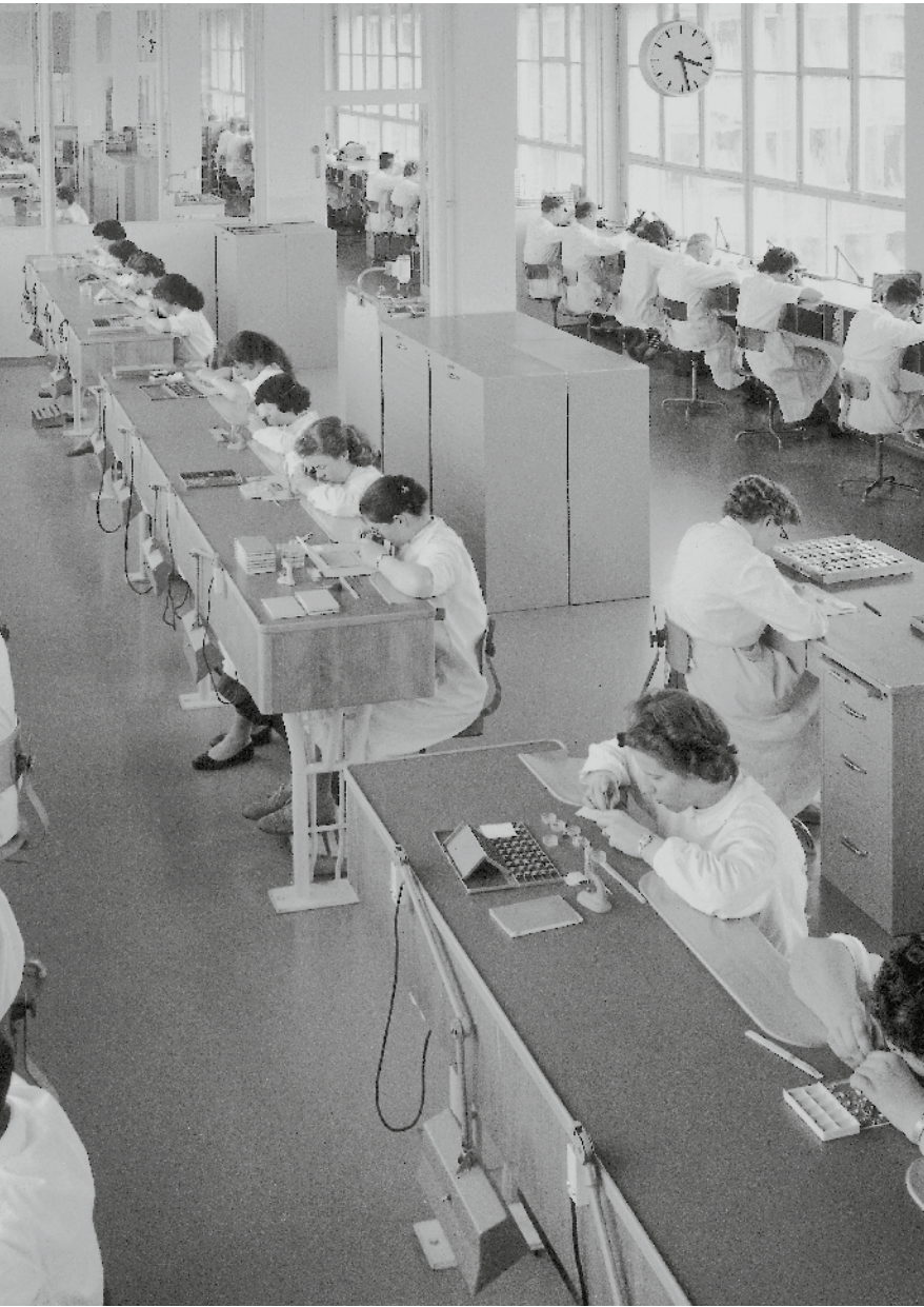
Uhrmacher, auch Rhabilleure genannt, in einem Atelier von Omega

eigene Serienproduktion aufzubauen. Die Fabriken stehen nicht mehr auf den verkehrstechnisch ungünstigen Jura-höhen, sondern am Übergang des Juras ins Mittelland. Die neuen Uhrmacher sind auch nicht mehr die «Künstler» von früher – solche gibt es zwar weiterhin in den Bergen, doch was sie produzieren, gilt jetzt als teures Luxusgut. In den Fabriken werden auch ungelernete Arbeiter eingestellt. In Biel und Grenchen, zwei neuen Zentren der Branche, entsteht ein klassisches Industrieproletariat. Die Arbeiter organisieren sich und wählen rote Stadtregierungen. Fast wöchentlich gibt es irgendwo Arbeitskämpfe, in denen es meist um die Löhne geht. Von 1882 bis 1911 verzehnfacht sich die Anzahl der Fabriken, zu