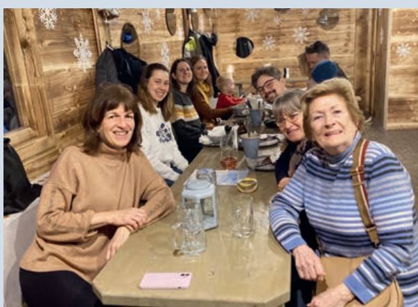
Gemütliches Beisammensein nach dem Eislaufen

landschweizer-Bashing». Für uns war das Grund genug, zu einem politischen Diskussionsforum einzuladen, an dem sich immerhin 12 Mitglieder rege beteiligten.