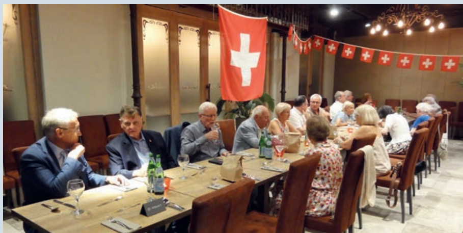
1. August-Feier mit dem Schweizer Botschafter