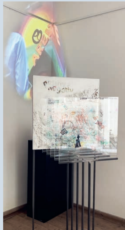
DIE PANDEMIE-TOMOGRAFIE Eisen | Mixed Media auf Leinwand | edding auf Acrylglas | 172 x 76 x 76 cm

Yoly Maurers Beitrag nennt sich «InProgress» und beschreibt damit das Fortschreiten eines Prozesses, sowohl mit persönlichem Eingreifen, als auch durch nicht aufzuhaltende äussere Einflüsse. Bei der persönlichen Veränderung durch Übermalung, Überschreibung, das Eingreifen in den Malprozess einer oder mehrerer Personen, verändert sich das Bild in kurzen Abständen. Durch das permanente In-Frage-stellen des Vorhandenen und das «immer wieder korrigieren» wird der Prozess erfahrbar; er kann auch durch das Entfernen von Malschichten bis weit zurück wieder sichtbar gemacht werden. ( www.yoly.org )