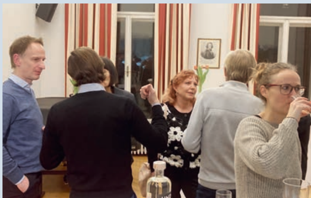
Impressionen vom Neujahrs-Apéro

In der Debatte sind die Auslandschweizerinnen und Auslandschweizer und Rentenbezüger im Ausland ins Fadenkreuz der Schweizer Politiker geraten. Die an sich wichtige und spannende AHV-Abstimmungsdebatte wurde zum «Aus-