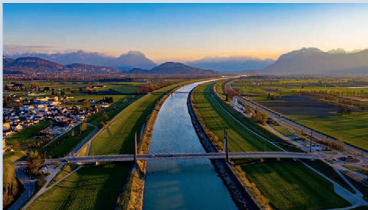
Der Rhein jetzt (links) und künftig im naturnahen, breiten Flussbett (rechts)

Der Staatsvertrag zwischen Österreich und der Schweiz für das Hochwasserschutzprojekt «Rhesi» soll im Mai 2024 unterschrieben werden. Das bestätigte Landeshauptmann Markus Wallner (ÖVP) dem ORF. 1,9 Milliarden Euro wird das Riesenprojekt kosten, das den Hochwasserschutz am unteren Alpenrhein (Grenzregion zwischen dem Bundesland Vorarlberg und dem Kanton St. Gallen) massiv verstärken soll.