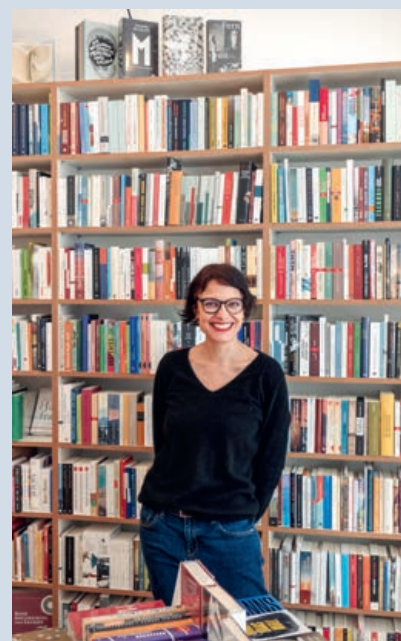
OECHSLI BUCH & PAPIER, Berggasse 27, 1090 Wien, Tel. +43 1 399 61 26 www.buchundpapier.at

noch gar nichts gewusst hat», steht in der Begründung der Jury für die Auszeichnung im Jahr 2022. Dem ist nicht viel hinzuzufügen, ausser die Adresse: