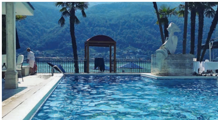
Familie Bolt, Tessin

Ihre Britta Eigner Regionalredakteurin Liechtenstein