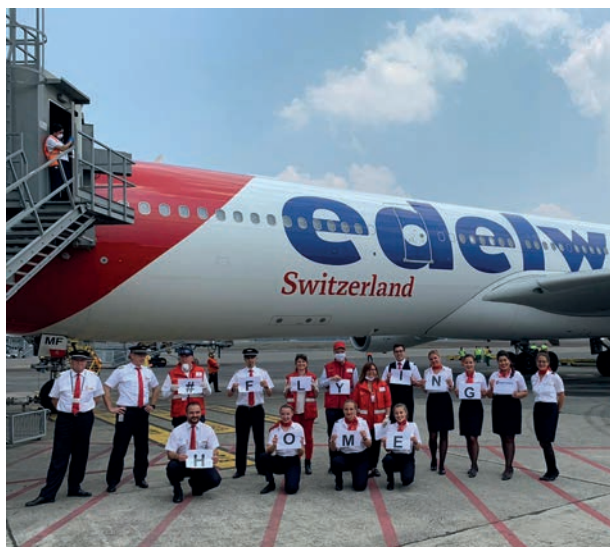
Sugerente imagen antes de la partida