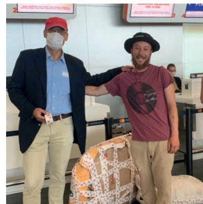
El Sr. Embajador y el agradecido ciclista con su bicicleta

aerolíneas a fin de brindar a suizos y suizas varados en Latinoamérica oportunidades para volver a su casa y apoyarlos en su regreso. Principalmente, se trató de hacer disponibles informaciones relevantes y coordinar esfuerzos para viajar y cruzar fronteras en las circunstancias actuales. Por ejemplo, el gobierno uruguayo permitió a pasajeros de cruceros viajar en seguridad usando un "cordón sanitario" del Puerto de Montevideo al Aeropuerto de Carrasco, fuera de