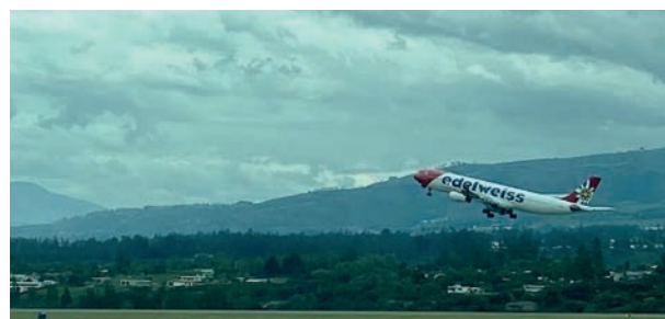
Partida del vuelo de Edelweiss

rias adicionales para COVID-19. Esto fue anunciado por el Vicepresidente Otto Sonnenholzner en las noticias: https://www.elcomercio.com/actualidad/otto-sonnenholzner-cadena-covid19-detenciones.html . Este dispositivo cuesta US $ 2 millones y fue totalmente donado por Roche.