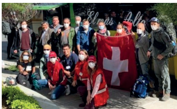
TURISTAS SUIZOS EN LA PAZ ANTES DEL VIAJE EN BUS A SANTA CRUZ (31.03)

Después del 21.03.2020 aún había 90 turistas suizos varados en Bolivia. La Embajada de Suiza en Bolivia realizó la tarea de contactar a todos estos turistas que habían registrado su viaje en Bolivia vía la aplicación Travel App. Por el hecho de que Bolivia no contaba con un número de turistas suizos suficientemente alto, no era posible organizar un vuelo de repatriación directo a Suiza. Por lo tanto, la única esperanza de la Embajada de Suiza en Bolivia era obtener algunos asientos para ciudadanos suizos en vuelos organizados por otros países europeos. Gracias a la Embajada de Francia y a la Embajada de Alemania en Bolivia, más de sesenta suizos pudieron salir del país entre el día 21.03.2020, cuando empezó la cuarentena total hasta el día sábado 04.04.2020.