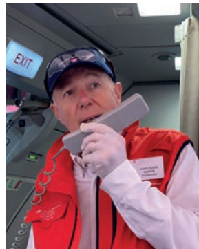
El Embajador Hans-Ruedi Bortis despide a los viajeros en la cabina del avión