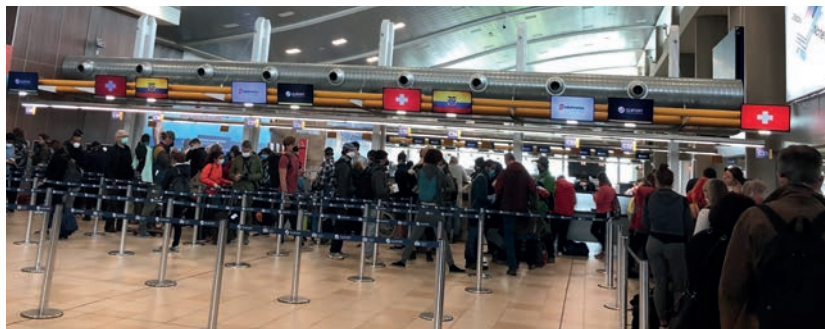
Check in en el Aeropuerto Internacional Mariscal Sucre/Quito

• La farmacéutica Roche en Ecuador realizó una donación al gobierno ecuatoriano de una plataforma de diagnóstico molecular para realizar alrededor de 1.000 pruebas dia-