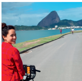
Praia do Flamengo antes do confinamento

Quando soube que minha candidatura para realizar um estágio acadêmico no Consulado Geral da Suíça (CG) no Rio de Janeiro foi aceite, nunca teria imaginado que uma pandemia pudesse abalar todos os planos para os seis meses que iriam seguir. Depois de três semanas fui "condenada" ao home office .