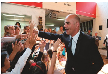
Conselheiro Federal, Sr. Alain Berset com alunos

Durante o delicioso almoço tipicamente suíço – Raclette e Goulasch com Spätzli (nhoque suíço) – o principal desejo manifestado pelo Sr. Berset, de estar próximo das famílias e dos convidados o maior tempo possível, foi atendido.