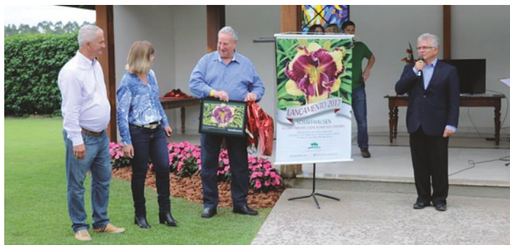
Membros do Comitê Brasil/Suíça

No 15º Festival de Hemerocalis, foi lançada uma flor com o nome de Schaffhausen, em homenagem aos imigrantes Suíços, que vieram do Canton de Schaffhausen, para a cidade de Joinville, em Santa Catarina, no Brasil. Foram estes primeiros imigrantes que ajudaram a fundar, no dia 09 de março de 1850, a cidade denominada, hoje, de Joinville.