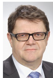
IVO DÜRR, REDAKTION