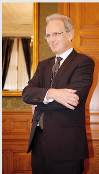
Referent Hans-Ulrich Bigler, Direktor des Schweizerischen Gewerbeverbandes, einer der prominentesten Schweizer Wirtschaftspolitiker

Mit diesem namhaften Gast hat sich einmal mehr die erfolgreiche Ausrichtung der HSU Zürich auf den bilateralen Mittelstand und seine vielfältigen Belange in den Beziehungen Schweiz-Ungarn bestätigt. Der gut und ausgesprochen prominent besuchte Zürcher HSU-Vortrag von Hans-Ulrich Bigler war in diesem Sinne ein charmant vorgetragener Berner Appell zur Rückbesinnung auf die genuinen Stärken des Mittelstandes. Damit konnten nicht nur die im Partnerland Ungarn engagierten KMU-Unternehmer vom Referat profitieren. Die vor-