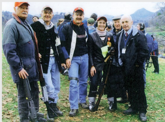
Ueli Maurer mit den Schweizer Schützen aus Österreich am Morgarten.

Ein ganz besonderes Anliegen seit Jahren ist und bleibt für mich die Förderung der Jugend,