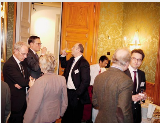
Angeregte Unterhaltung am Buffet.