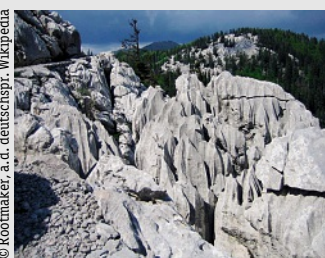
Karstformationen Nationalpark Nord-Velebit

Das Zentrum befindet sich „dicht an der Natur“, sozusagen im Schatten des Berg-Massivs Velebit. Das Zentrum ist neu ausgebaut und bietet ausser Übernachtungs- und Verpflegungsmöglichkeiten auch verschiedene Unterhaltungsmöglichkeiten: kreative und sportliche Betätigungen, schöne