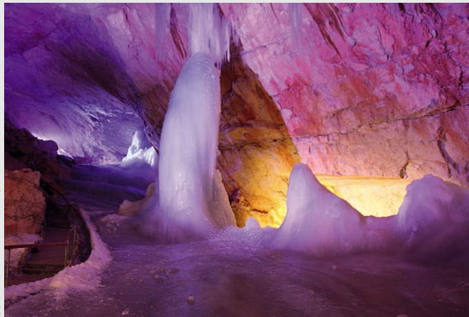
Dachstein Eishöhle im Salzkammergut

Nähere Informationen unter http://www.dachstein-salzkammergut.com/ .