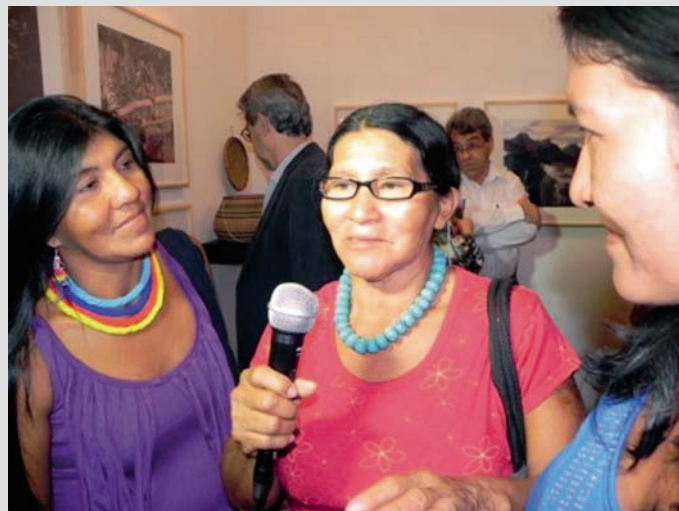
Representantes de la Etnia Ye'kwana del Río Caura

Esta exposición presentó tres aspectos notorios de la cultura de ambos países. Los hermosos paisajes de la Selva Tropical venezolana en su mayor amplitud, naturaleza, paisaje y entorno natural a través de los ojos de un suizo que emigró a Venezuela en 1947: Karl Weidmann. Notables fotografías que fueron acompañadas de una impresionante muestra de lo mejor de los tejidos y cestas de la etnia Ye'kwana, labor ancestral de una cultura indígena inmersa