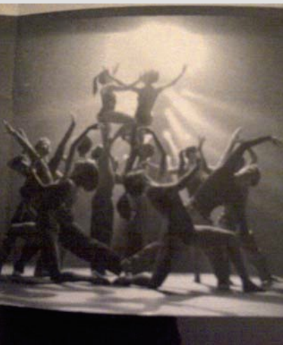
Ballet du Grand Théâtre de Genève

actividad teatral dedicada al autor de El Quijote.