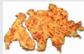
Schweizer Küche: mehr als Rösti (mit Röstigraben!)

Seitens des Vorstandes vom Schweizerverein Steiermark wurde in den letzten Monaten eifrig gesammelt und gearbeitet, um speziell für unsere Mitglieder einige Schweizer Bücher zu erstellen.