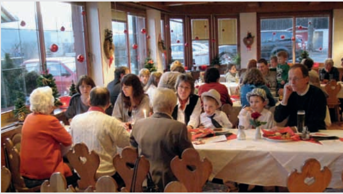
Eine stimmungsvolle Samichlaus-Feier in Tirol!

danken und Informationen auszutauschen zu können.