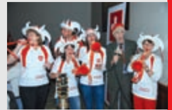
Equipo de la Embajada de Suiza

Con motivo de la clasificación de la selección suiza al Mundial Sudáfrica 2010, la Embajada de Suiza en Quito organizó un Public Viewing del partido de fútbol Suiza vs. España que tuvo lugar el 16 de junio en el Swissôtel.