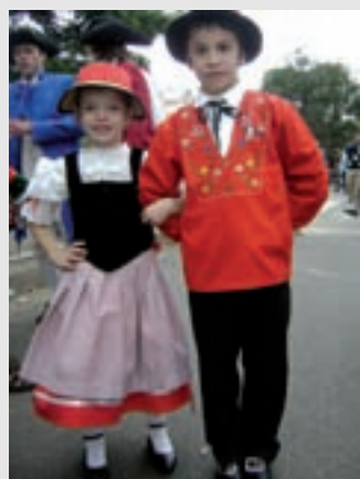
Infancia con identidad suiza

de 2010 y seguirán durante los próximos meses. Los festejos oficiales comenzaron el viernes 21 con la inauguración del Paseo del Bicentenario en la emblemática Av. 9 de julio.