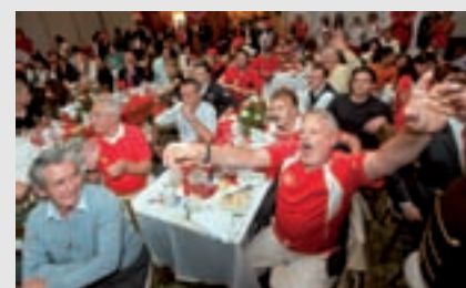
Salón Saint Moritz, Swissôtel

Los invitados disfrutaron además de la gastronomía suiza y de premios que fueron sorteados en el evento. Esta fiesta deportiva tuvo gran acogida de los medios de comunicación y contó con el auspicio principal de Holcim Ecuador SA y el Swissôtel.