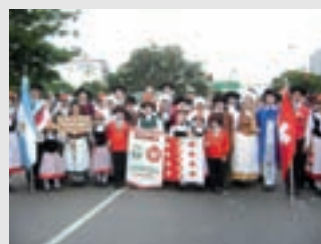
Delegación de Rafaela, Provincia de Santa Fe.

La delegación que representó a Suiza estuvo integrada por la Federación de Asociaciones Suizas de la República Argentina, Entidades Valesanas Argentinas