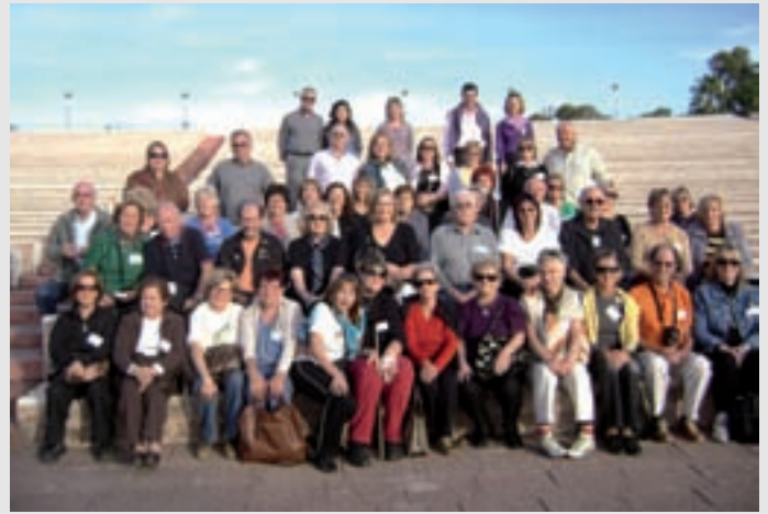
La delegación argentina en el anfiteatro de Paysandú